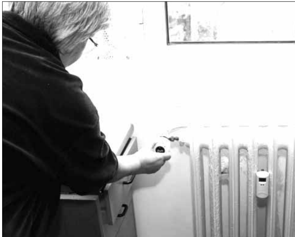
Primăria a pus în consultare publică Strategia serviciului de alimentare cu energie termică a consumatorilor din Cluj-Napoca în perioada 2021-2030 și perspectivă 2050

În acest context, în vederea aprobării strategiei, Primăria Cluj-Napoca a anunțat