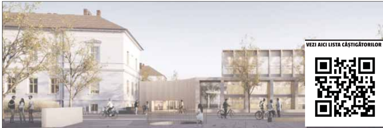
SQM Architecture va proiecta planul pentru extinderea și modernizarea Liceului „Nicolae Bălcescu” și a zonei adiacente

„Vă felicit și vă mulțumesc. Este primul concurs de soluții din domeniul educației, am mai avut 7 concursuri de soluții până acum iar acesta este primul de acest fel și arată direcția europeană, modernă a orașului. Acest lucru nu ar fi fost posibil fără o viziune din partea orașului. Am aflat acum câteva minute că