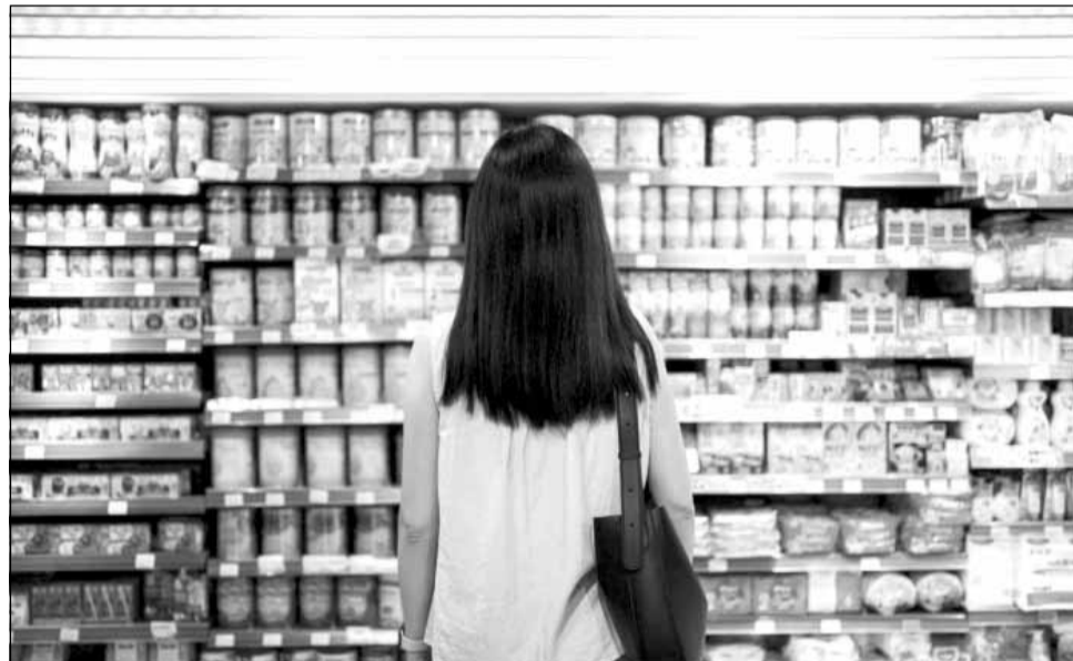
Controale ale Comisariatul Județean pentru Protecția Consumatorului în lanțurile de magazine din Cluj

De asemenea, au fost depistate situații de diferențe între prețul produsului la raft