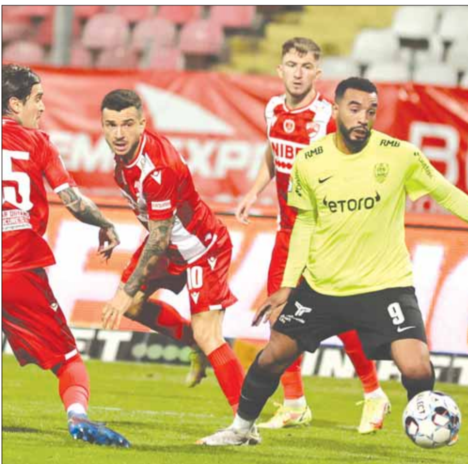
CFR Cluj a învins pe Dinamo București cu scorul de 3-0, într-o partidă din etapa a XV-a a Ligii I la fotbal

Ultimul succes al grupării bucureștene datează din data de 2 august 2021 (etapa a treia), atunci când alb-roșii au trecut cu 3-1 de Academica Clinceni.